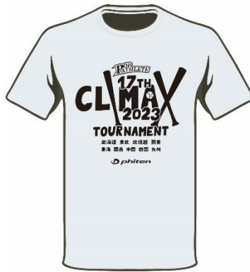
ホワイト/ブラック ¥2,800