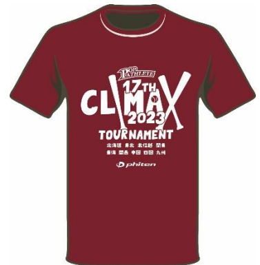
バーガンディ/ホワイト ¥2,800

※ご注文後の制作となります。発送まで 2 か月ほどかかりますのでご了承ください。