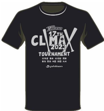
ブラック/シルバー ¥2,800